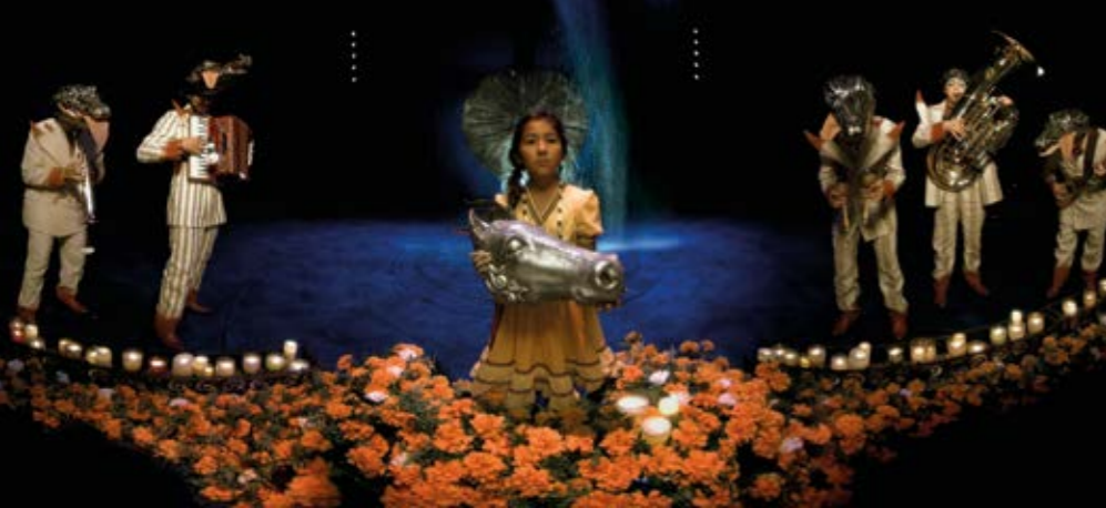
Through the Masks of Luzia, Félix Lajeunesse, Paul Raphaël, François Blouin